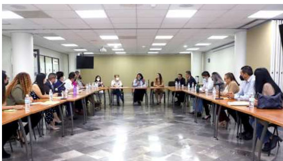
Participantes en el diálogo interinstitucional

Esta nueva forma de desahogo de las audiencias, se deriva del resultado exitoso del proyecto denominado “Reto de 100 días”, trabajado con la organización USAID—ConJusticia, en el que se enfocaron a incrementar la solución de casos de violencia familiar y narcomenudeo, lo cual fue logrado con alta efectividad.