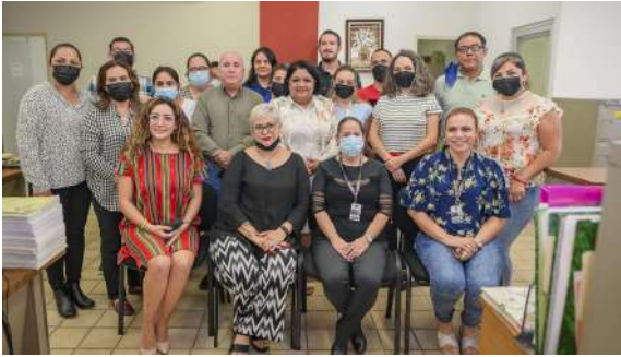
Juzgado Familiar en Ciudad Valles