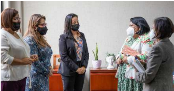
Juzgados Familiares en Ciudad Judicial