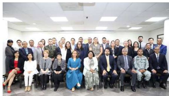
Clausura del Ciclo de Conservatorios Interinstitucionales

En los diálogos institucionales, participaron magistradas y magistrados del Supremo Tribunal de Justicia, Juezas y Jueces de Control y de Tribunal de Juicio Oral, Ministerios Públicos, Defensores de Oficio, representantes de la Secretaría de Seguridad y de Protección Ciudadana del Estado, así como de las corporaciones municipales de San Luis Potosí y Soledad de Graciano Sánchez, de la Comisión Ejecutiva Estatal de Atención a Víctimas, del Centro Nacional de Inteligencia, de la Guardia Civil, de la Delegación de la Fiscalía General de la República y de la Unidad de Medidas Cautelares.