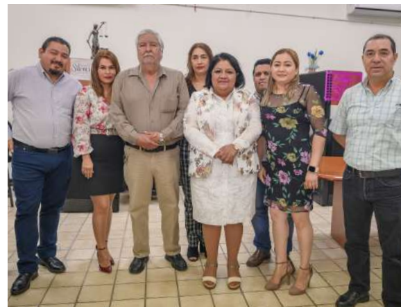
Juzgados Regional de Ejecución de Sentencias en Ciudad Valles