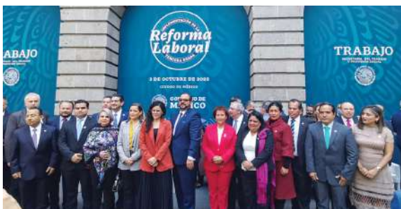
Ceremonia de inicio de la tercera etapa de la Reforma Laboral

Cabe recordar que el 18 de noviembre del 2020, San Luis Potosí inició la operación del nuevo modelo de justicia laboral junto con otras siete entidades del país, representando la primera etapa de esta importante reforma, la más importante en esta materia en los últimos 100 años.