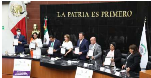
Convenio de colaboración con el Senado de la República