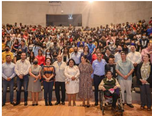
Conferencia UASLP, Ciudad Valles