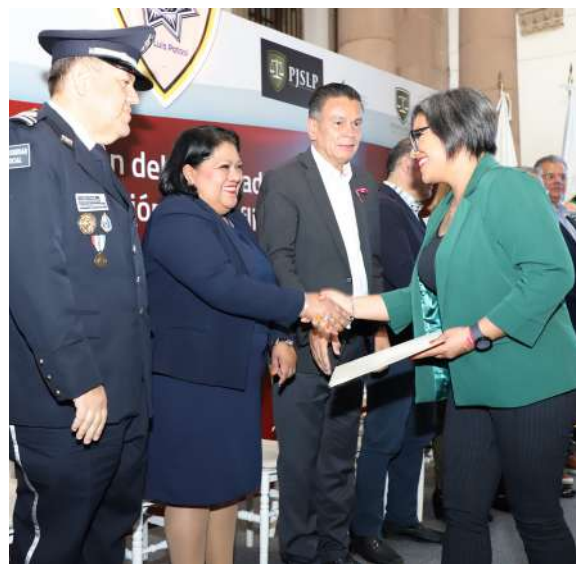
Entrega de constancias