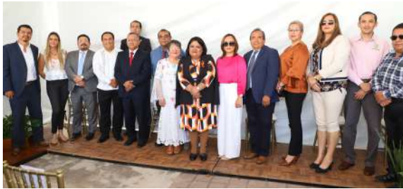
Inauguración del sicee en los Juzgados Especializados en Matehuala

de los servicios que se prestan a la población en estas regiones de la entidad y que, representa además el primer paso en la modernización digital, como un instrumento de acceso a la justicia.