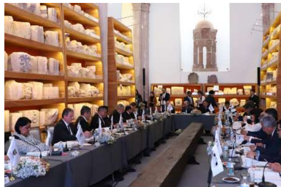
Tercer Asamblea. Sede Zacatecas