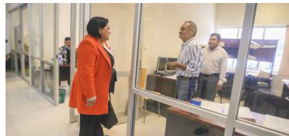
Centro de Justicia Penal de Tancanhuitz