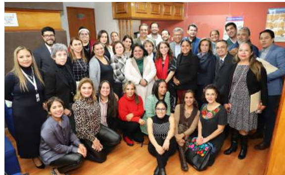
Participantes del Diplomado de Métodos Alternativos de Solución de Conflictos y Mediación Policial

Por otra parte, al concluir el Taller “Prácticas de Mediación”, llevado a cabo por el Centro Estatal de Mediación y Conciliación, se entregaron las constancias a sus participantes.