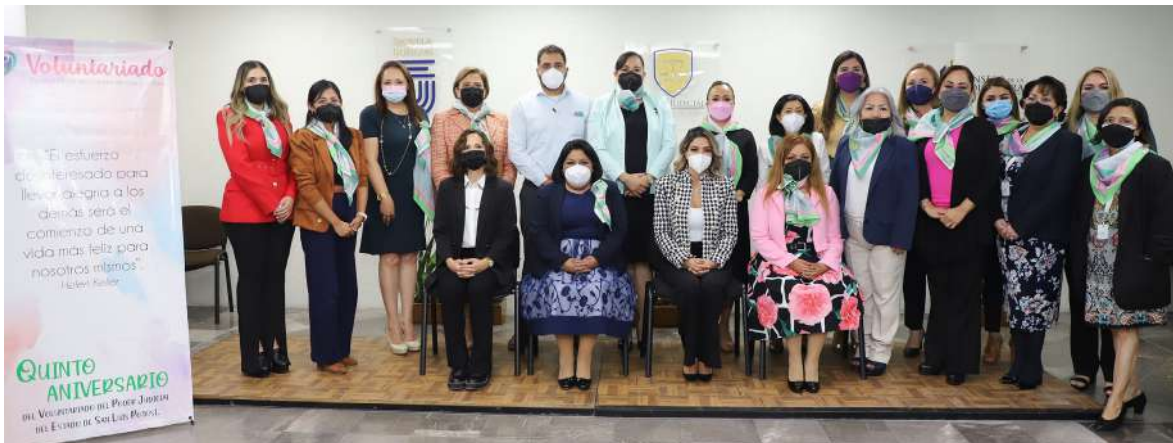
Celebración del quinto aniversario del Voluntariado del Poder Judicial del Estado