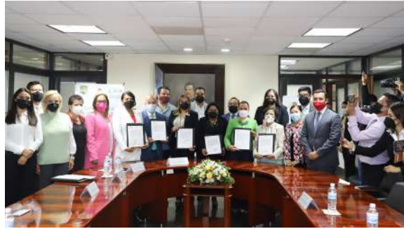
Congreso del Estado