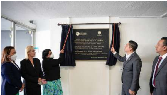
Digitalización del Archivo Judicial