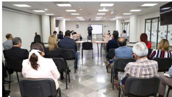
Curso a Segunda Instancia