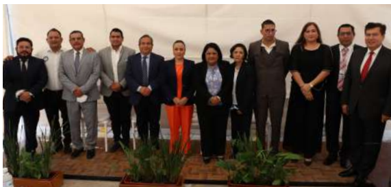
Inauguración del sicee en los Juzgados Especializados en Rioverde

Diálogo interinstitucional sobre audiencias en bloque Instituciones operadoras del sistema de justicia penal, participaron en un diálogo técnico interinstitucional convocado por el Poder Judicial sobre las “audiencias en bloque”, un nuevo modelo que se empieza a trabajar en los Centros de Justicia, el cual consiste en concentrar en una sola fecha y hora, diversas audiencias por determinados delitos con diversos imputados para resolver su situación jurídica.