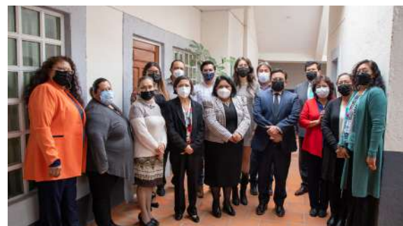
Juzgado Mixto de Primera Instancia de Santa María del Río