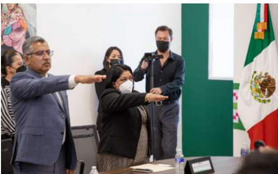
Sistema Estatal de Búsqueda de Personas

La Magistrada Presidenta rindió protesta como integrante del Sistema Estatal de Búsqueda de Personas Con la representación del Poder Judicial del Estado, la Magistrada Presidenta Olga Regina García López, rindió protesta como integrante del Sistema Estatal de Búsqueda de Personas, con la finalidad de trabajar conjuntamente con Gobierno del Estado de San Luis Potosí y las autoridades participantes en las acciones y políticas públicas relacionadas con la búsqueda de personas, para dar cumplimiento a las determinaciones del Sistema Nacional y de la Comisión Nacional de Búsqueda de Personas, así como lo establecido en la Ley General de la materia.