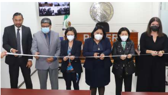
Inauguración de la Sala de Oralidad Especializada para Adolescentes en conflicto con la ley penal

Además, la reorganización de espacios ha permitido que el sistema penal acusatorio para adultos, cuente con nueve salas para el desahogo de audiencias, sumando 3 a las 6 ya existentes.