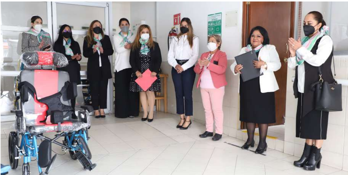
Entrega de donativo al Centro de Asistencia Social Eben Ezer

Por otra parte, se hizo entrega de una silla de ruedas PCA, a un beneficiario del Centro de Asistencia Social Eben Ezer, con el objetivo de ayudarle a disminuir las dificultades de movilidad a las que se enfrenta diariamente.