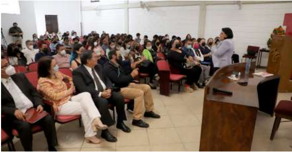
Conferencia en la Universidad de Matehuala