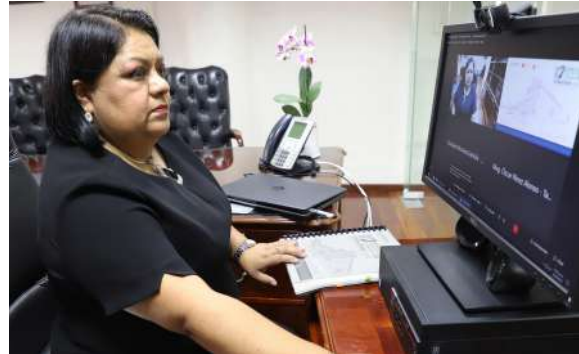
Segunda Asamblea. Sede Zacatecas

Con el objetivo de impulsar la discusión y aprobación del Código Nacional de Procedimientos Civiles y Familiares , la CONATRI celebró una reunión con la Junta de Coordinación Política, la Comisión Segunda y la Comisión de Justicia del Senado de la República, en la cual, las magistradas y magistrados presidentes de los Tribunales Superiores de Justicia detallaron la necesidad de una legislación moderna y ofrecieron sus experiencias para que se consolide un modelo de justicia cercano a la gente.