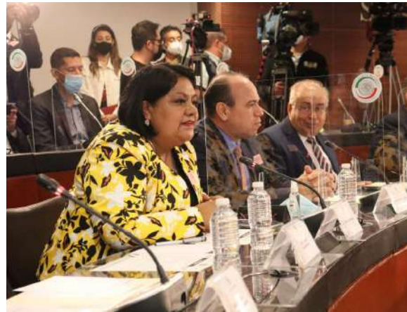
Senado de la República