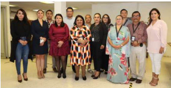
Juzgado Civil de Rioverde