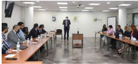
Curso de Conducción de Audiencias

El Doctor Pablo Héctor González Villalobos, Magistrado del Poder Judicial del Estado de Chihuahua impartió diversas capacitaciones al funcionariado jurídico de primera y segunda instancia en temas del sistema penal acusatorio.