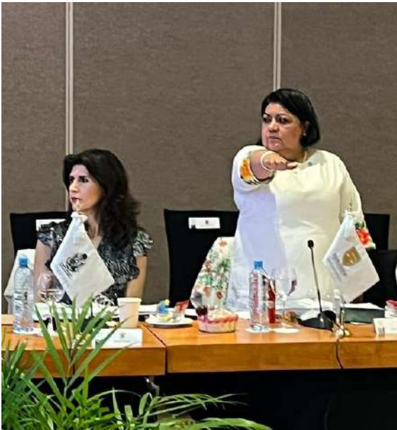
Protesta como Vocal en la Mesa Directiva