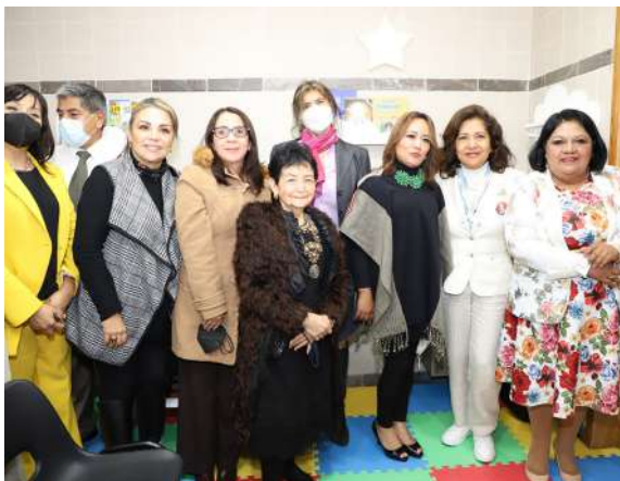
Inauguración de Ludoteca